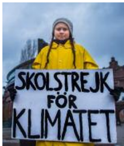
La giovanissima Greta Thunberg che guida la marcia dei giovani per la Terra.

Risorto noi abbracciamo i vicini e i lontani, gli uguali e i diversi. E se non siamo disposti ad abbracciare questi ultimi, allora è meglio "non fare Pasqua", perché sarebbe solo ipocrisia e bestemmia.