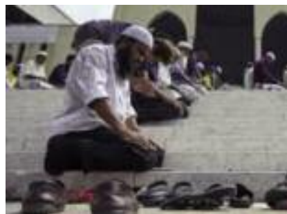
Musulmani in preghiera davanti alla sinagoga della strage più grande.