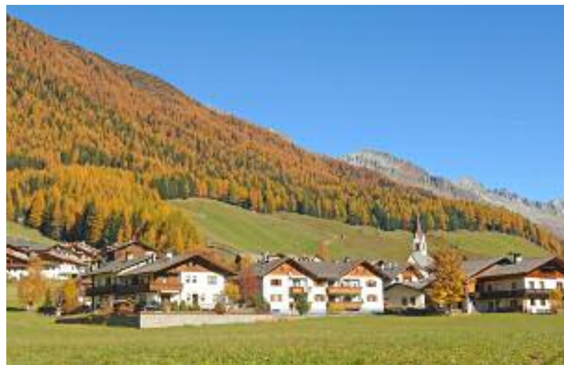
Casa Weiherhof, sede del nostro soggiorno, nel villaggio di Predoi (sopra) in Valle Aurina.