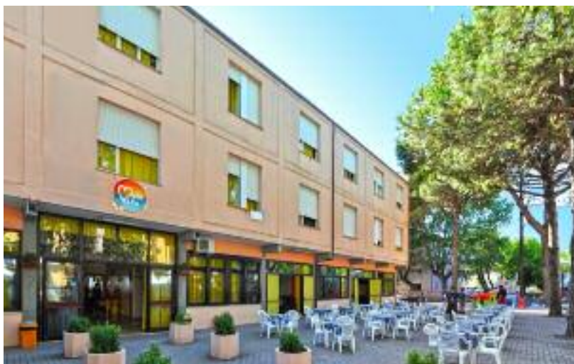
La pensione "Mare e Vita" a Pinarella di Cervia.

Un'altra esperienza che da tanti anni ci accompagna durante l'estate è il campo scuola giovani. Quest'anno c'è una grande novità: per la prima volta il campo scuola sarà al mare! Saremo ospiti della pensione "Mare e Vita" a Pinarella di Cervia nella settimana dal 7 al 14 luglio.