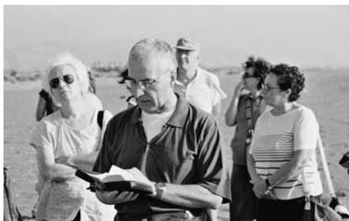
Sulla spiaggia, nei pressi del porto Seleucia, da dove Paolo ha iniziato il suo viaggio missionario.