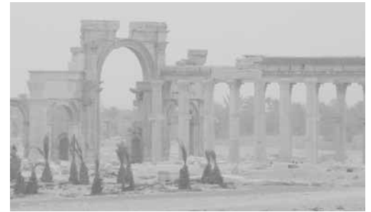
Palmira nella tempesta di sabbia.

Mercoledì raggiungiamo Antiochia, dopo una lunga sosta al confine con la Turchia. La grotta di Pietro e la spiaggia. Niente di particolare in sé (la spiaggia poi è piena di rifiuti e siringhe). Ma qui hanno predicato i primi discepoli di Gesù e Paolo con la nave ha preso il largo proprio sul mare che