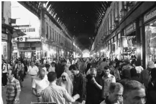
Il suk di Damasco.

Il pomeriggio visita super rapida al Suk,