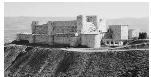
Il Krak dei Cavalieri, la fortezza crociata più bella del Medio Oriente.