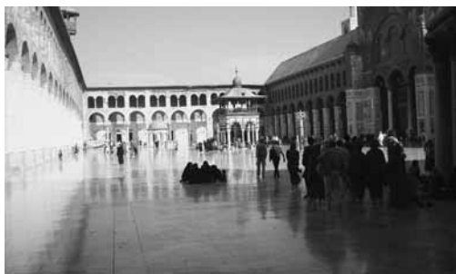
Cortile della Moschea degli Omayyadi.

Al Museo mi emoziona vedere, con l'ausilio di una lente, i minuscoli caratteri incisi su una tavoletta che formano un alfabeto antichissimo, da cui presero poi origine il greco e il latino.