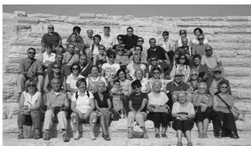
Tutto il gruppo all'interno dell'antico Teatro Romano di Palmira.