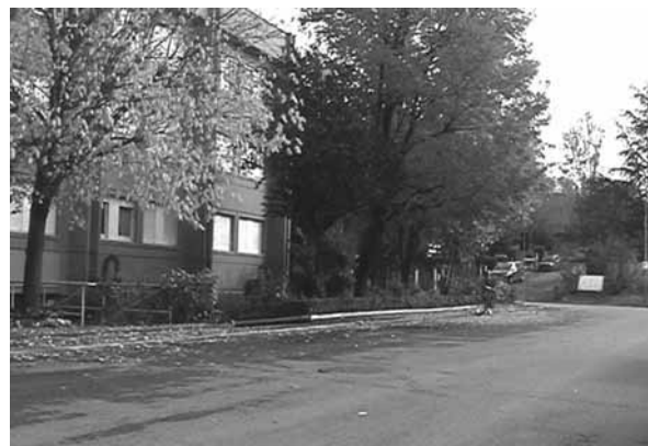
Scorcio del quartiere PEEP. Sulla sinistra la casa degli incontri del Vangelo.