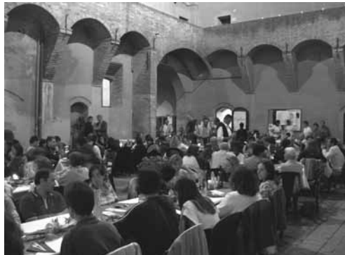
La cena cilena nel cortile della Rocca di Bazzano