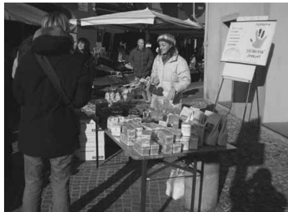
Un banchetto dell'Associazione al mercato del sabato a Bazzano