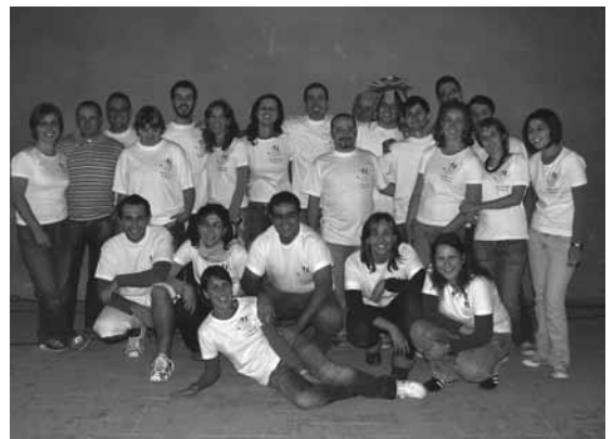
I volontari dell'Associazione "in divisa" (anche questa una conquista di quest'anno)

Banchetto dei genitori pro Scuola Materna Parrocchiale