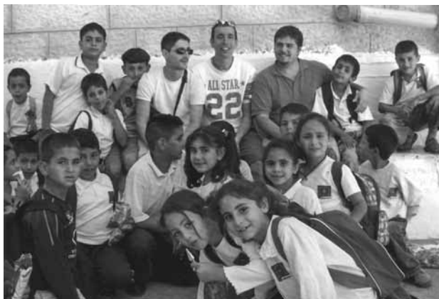
Alcuni nostri giovani di Bazzano con i ragazzi Aboud

Ho avuto la grazia di andare due volte ad Aboud e per due volte ho sperimentato quanto i fratelli cristiani di questo villaggio palestinese siano... uguali a noi.