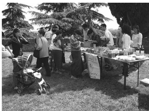
Uno dei tanti "banchetti" della domenica sul sagrato della chiesa