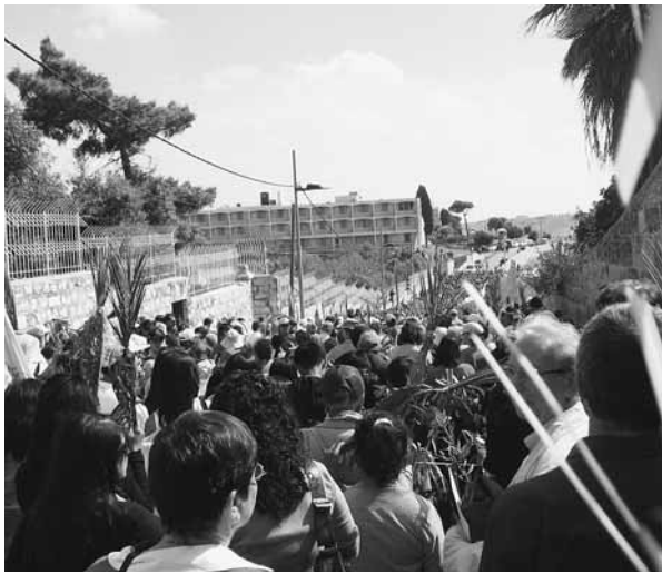
La processione delle Palme da Betfage a Gerusalemme