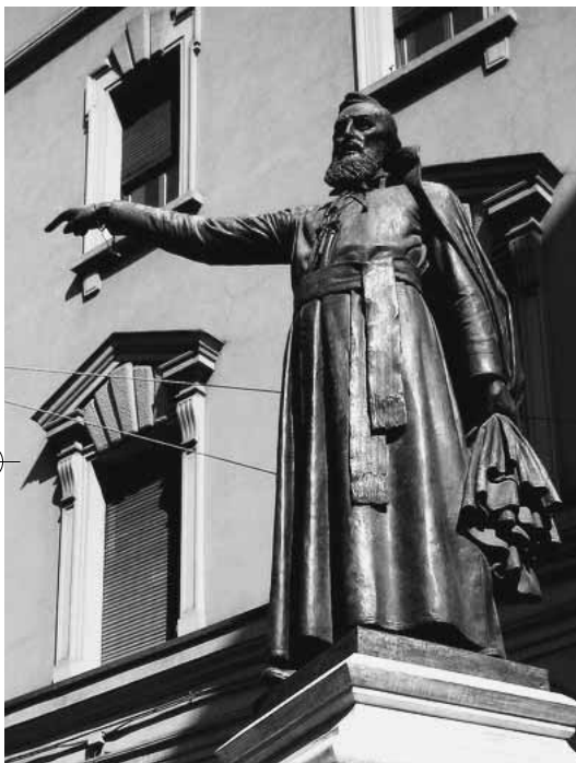
Bronzo di Carlo Parmeggiani dedicato al P. Ugo Bassi, collocato ora nell'omonima via di Bologna. Fino a qualche anno fa era su un alto piedistallo a base ottagonale su cui ora si trova una statua equestre di Garibaldi.

Il "Centro di studi Tommaso Casini" – diretto da Marco Veglia dell'Università di Bologna presso la Fondazione Rocca dei Bentivoglio di Bazzano – il 4 maggio u.s. ha organizzato in loco un convegno di studio sulla figura di questo patriota, avvalendosi del contributo dei relatori Bruno Tabacci, Umberto Carpi, Fiorenza Tarozzi e Otello Sangiorgi. Si è trattato della prima di una serie di iniziative in programma nel biennio 2010-2011, volte a celebrare la ricorrenza del 150° anniversario dell'Unità d'Italia, attraverso la riscoperta della lezione degli uomini che vissero tra il 1860 e la prima guerra mondiale, soprattutto (ma non solo) di Bologna e provincia. Cogliamo dunque l'occasione per proporre una succinta biografia di questo personaggio.