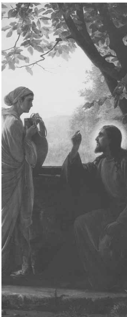
Gesù e la Samaritana, di Carl Heinrich Bloch, pittore danese (dipinto tra il 1865 e il 1879)

P otevo incominciare la mia lettera in modo formale, dicendo: "Il Consiglio pastorale vicariale, nella seduta del 3 maggio scorso, ha riconosciuto l'importanza della Bibbia o Parola di Dio e ha deliberato, come primo frutto del Congresso eucaristico, la lettura quotidiana della stessa. Pertanto, si è deciso di consegnare alle parrocchie un calendario per la lettura quotidiana di tutta la Bibbia. Il Consiglio auspica la più ampia partecipazione e diffusione..."