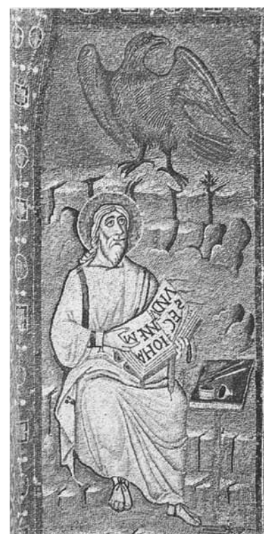
I quattro evangelisti, con i loro simboli. Da sinistra: Matteo (Angelo), Marco (Leone), Luca (Toro), Giovanni (Aquila). Mosaici della Basilica di S. Vitale (Ravenna).