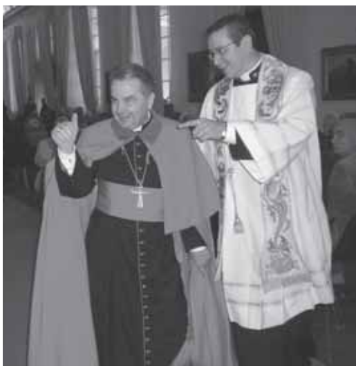
Sopra: Il card. Carlo Caffarra saluta e benedice il coro della parrocchia di Montebudello.